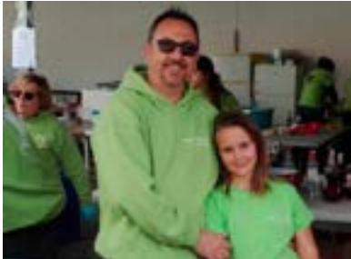
La fiesta de Moros y Cristianos está a la vuelta de la esquina, y por ello las diferentes